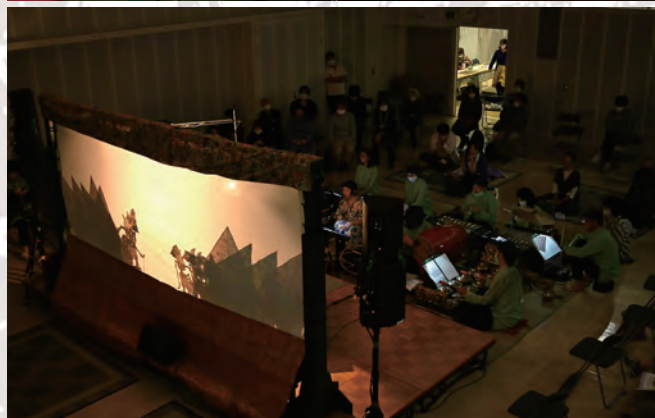
↑2020年の公演「サルヨの死」@目白教育ホールより