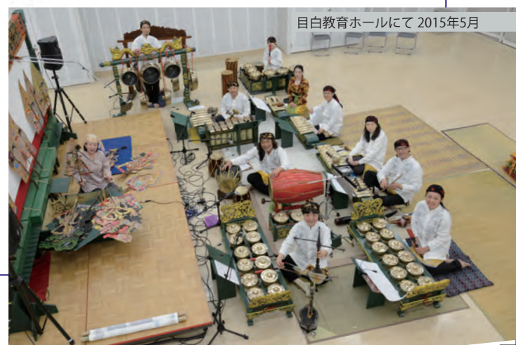
目白教育ホールにて 2015年5月