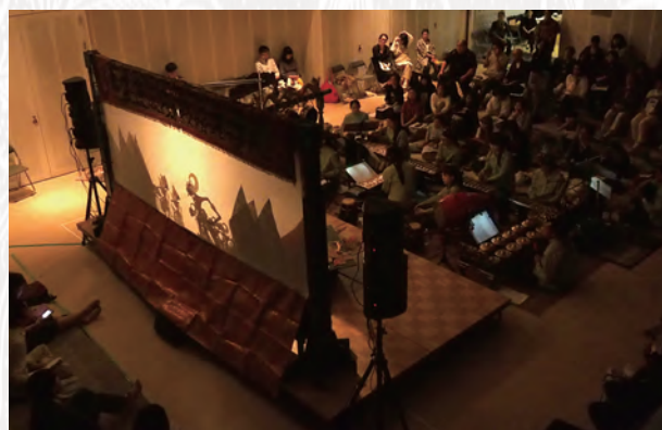
昨年の公演@目白教育ホールより